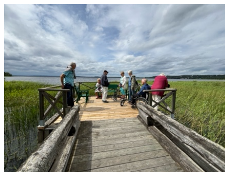
Bryggan provas av medlemmarna