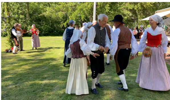
Folkdanslaget kom för dans på Sommarhemmet för 48:e året i rad, mycket uppskattat