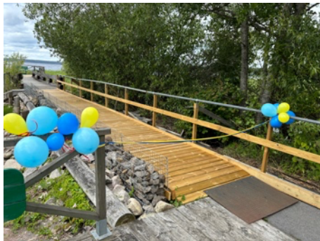
"Nya Bryggan" pyntad inför invigningen